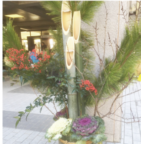
各教室の門松は先生たちの手作りです!

新しい年がいよいよ指して日々の練習によスタートしました。励みましよう! 今年の目標はできましたか? 3月には待ち待った相好カッ プが開催 されませう。優勝を目標ましよう! ち新たに、今年もまた一年頑張ります! てて、気持ち自分なりの目標を立て、