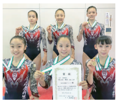
△団体3位の成績を残したクラブの選抜メンバー

ハイで女子初となる団体3位。クラブの選抜メンバーでも団体3位入賞を果たすなど、今年も多く輝かしい成績を残すことができました。目標を立て、そこに向けて計画的に練習を積み重ねていく。それはきっと、こどもたちも同じだと思います。毎回の練習を積み重ねることで新しい技を覚えて、テストで成功させる。そうして新たな目標を設定して挑戦する。すでに来年への戦いは始まっています。さらなる高みを目指して、練習に取り組んでもらいたいです。(大嶽 晃久)