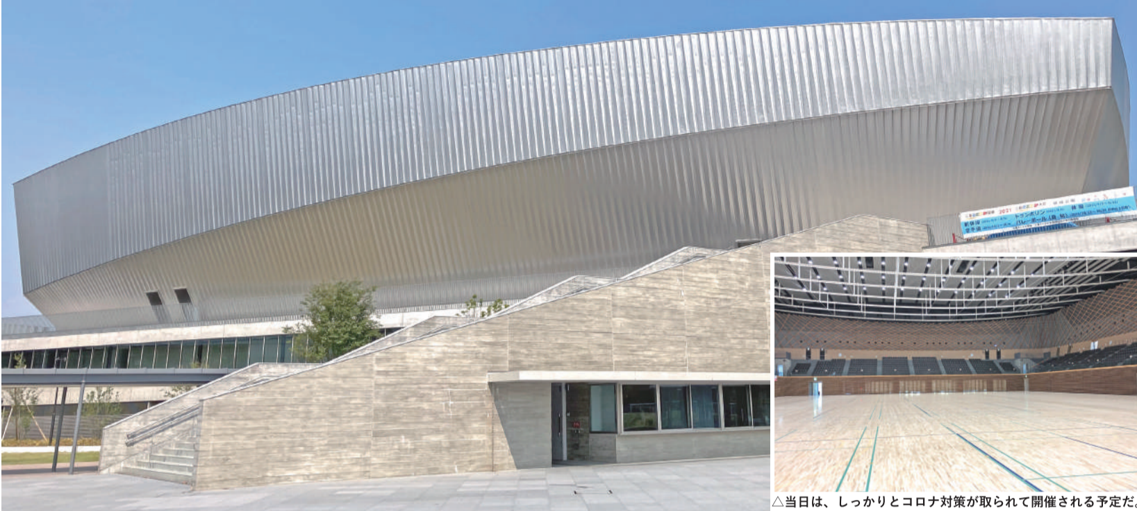
△当日は、しっかりとコロナ対策が取られて開催される予定だ。