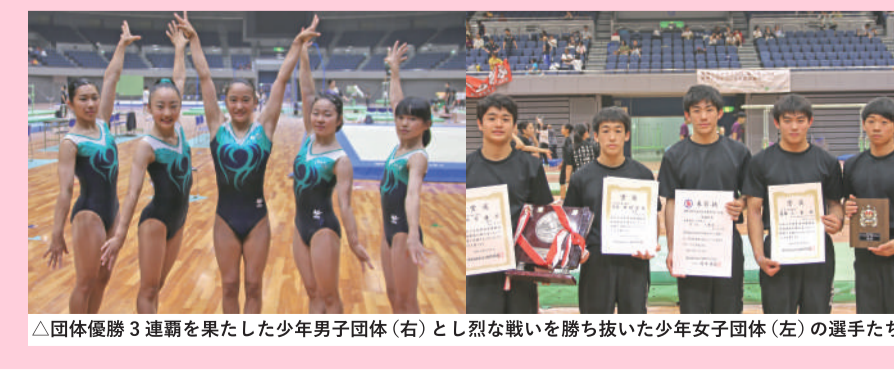
△団体優勝3連覇を果たした少年男子団体（右）とし烈な戦いを勝ち抜いた少年女子団体（左）の選手たち