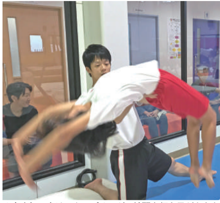
△丸山杯に向けてタンブリングの練習を行う子どもたち

通っている子どもたち1人1人が自分の目標を持って練習に取り組むながら、部活動のように、頑張っています。トレーニングから始まり柔軟、ドリル、宙返りなど内容は様々ですが、技が上手に成功するため繰り返して練習して、丸山杯に向けて練習も大詰めです。これから練習を重ねて、目標達成を目指していきます!